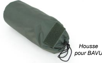
Housse pour BAVU

4 sangles de fixation polyvalente: exemple: FOXTROT LITTER