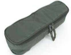
Housse pour masques

Poches accessoires, clips + MOLLE Clips également compatibles avec le sac léger d'intervention ou sac santé polyvalent réf. FOBSOL