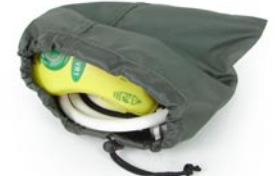
Housse pour respirateur